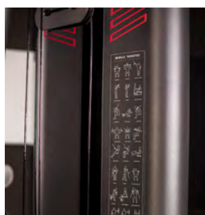
TABLA DE EJERCICIOS

La G128 incluye una prensa de piernas para trabajar el tren inferior de forma completa.